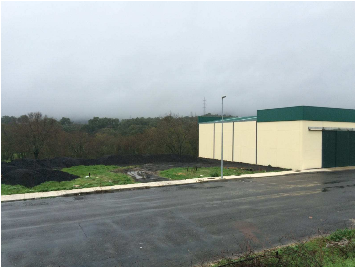
Vista de la parcela desde su lado sur

La zona donde se desarrollará la edificación está dotada de las infraestructuras adecuadas tales como saneamiento, abastecimiento de agua, electricidad, pavimentación, acerado y alcantarillado, puesto que la manzana se encuentra totalmente urbanizada y lista para comenzar la construcción.