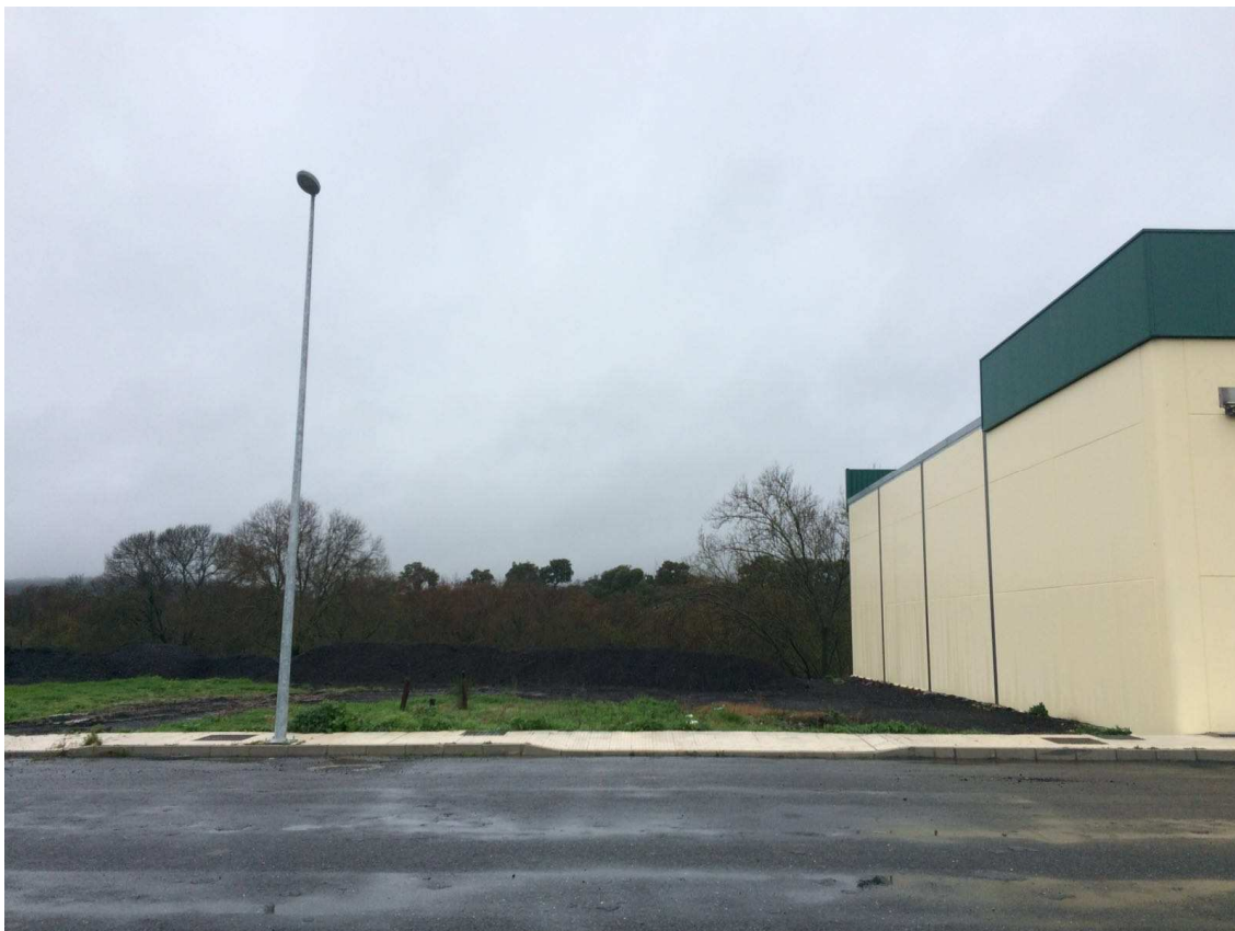
Vista de la parcela 45 desde su lado sureste.

El solar en el que se propone construir la edificación se corresponde con la Parcela 45, dentro de la Manzana 5 del sector I-6 del Parque Empresarial "Romanillos", en el Término Municipal de Aldeanueva del Camino, provincia de Cáceres.