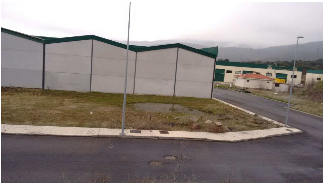
Vista de la parcela desde su lado sureste